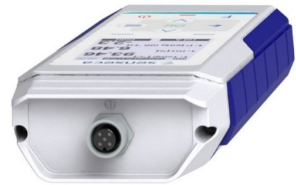
PRO D01 - 1 M12 Sensor Anschluss