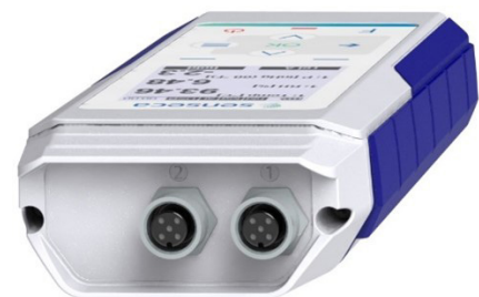
PRO D05.2 - 2 M12 Sensor Anschlüsse