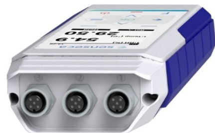
PRO D05.3 - 3 M12 Sensor Anschlüsse