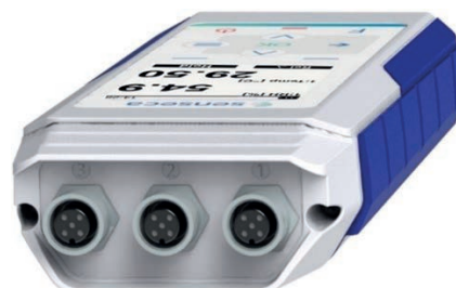
PRO D05.3 - 3 ingressi connettore M12