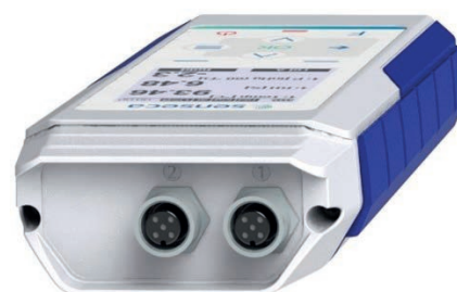
PRO D05.2 - 2 ingressi connettore M12