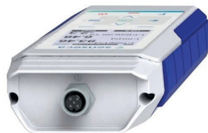
PRO D01 - 1 ingresso connettore M12